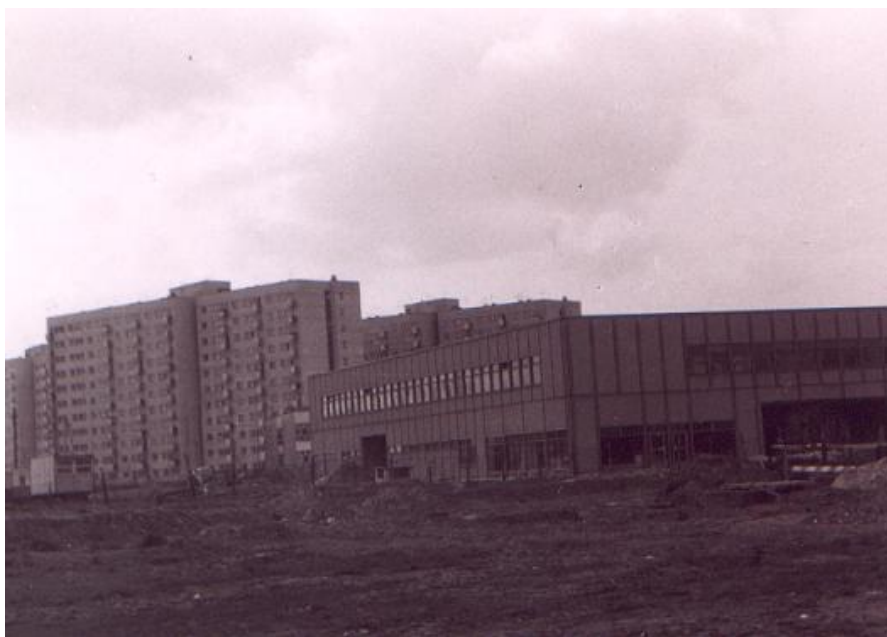
Budynek Domu Kultury „Kadr”