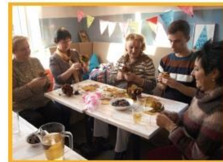
Centrum Społeczne Paca 40